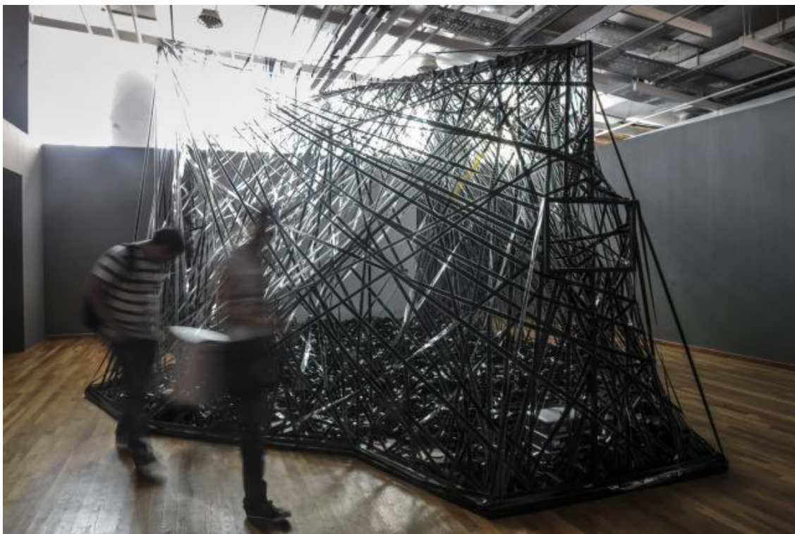
Operación fracaso y el sonido recobrado (Albertina Carri, 2015)

pasado, puede ayudar a experimentar un futuro pleno de ansiedad, pero aún sostenido en la construcción de su propio contra-archivo.