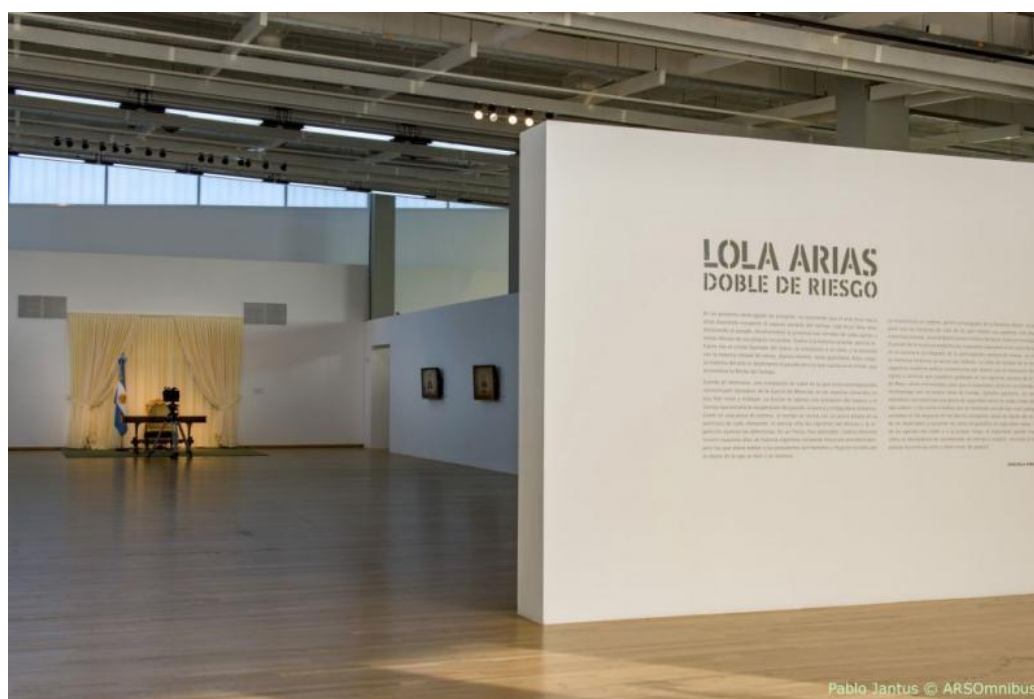
Doble de riesgo (Lola Arias, 2016)

Si recordamos que, tal como ha señalado Baronian (2010), las imágenes se pretenden prótesis de la memoria ante la falta de archivo escrito, en el caso de Arias se trata de refigurar ese archivo sonoro a través de la imagen con la ayuda de la escritura para así visibilizar la memoria y construir un contra-archivo: los performers como prótesis de las voces presidenciales suponen un acceso al pasado que es irónico por la distancia, pero auténtico por su capacidad para instituir sentido final. Son entonces esas imágenes en movimiento las encargadas de producir archivo ante la ausencia: es la imagen intentando ser memoria y constituirse en un archivo más auténtico y justo. En efecto, es el tratamiento de la búsqueda del conjuro de esa ausencia la que me interesa discutir finalmente aquí: ¿en qué medida esa posibilidad de triunfo de tal autenticidad no resulta en una reafirmación de la lógica clásica al momento de establecer la relación entre pasado, presente y futuro? Si el archivo se compone de retazos azarosos (Caimari, 2016: 75), ¿no se intenta aquí establecer una narrativa anclada en ciertos privilegios del presente que obturan cualquier preocupación por subvertir el orden de lo heredado?