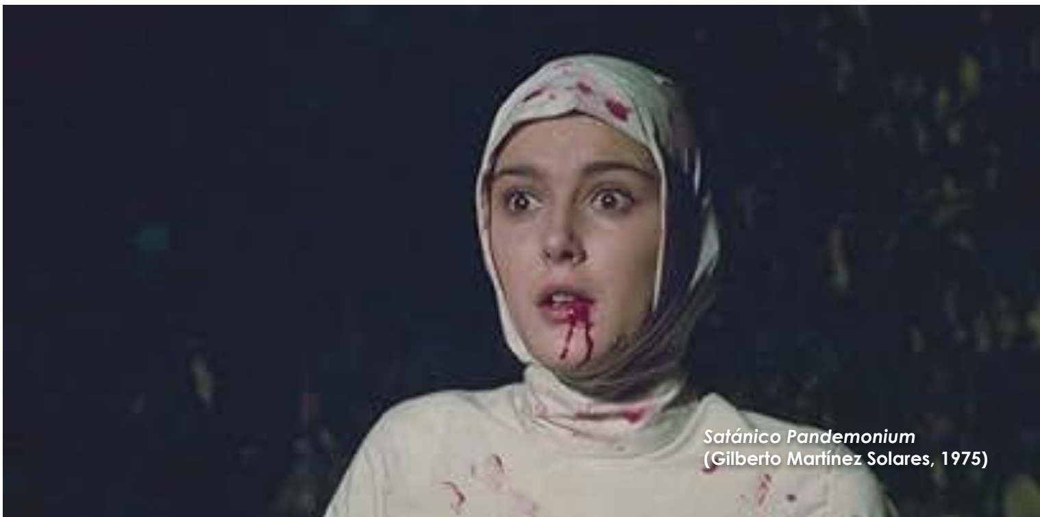
Satánico Pandemonium (Gilberto Martínez Solares, 1975)