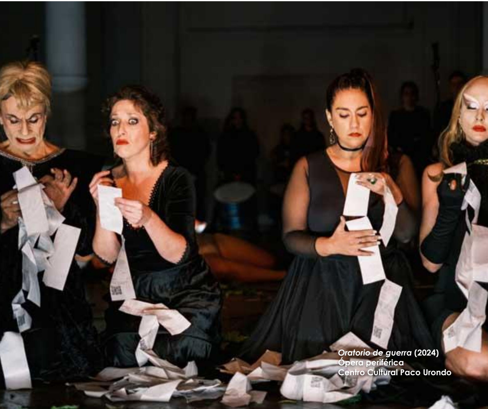
Oratorio de guerra (2024) Ópera periférica Centro Cultural Paco Urondo